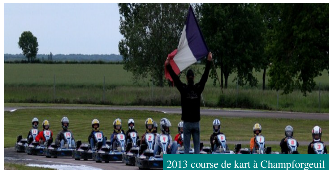
2013 course de kart à Champforgeuil