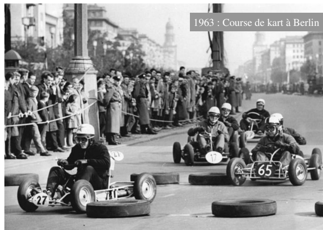
1963 : Course de kart à Berlin

Un système de chronométrage électronique de type F1 permet à chaque pilote, tour par tour, de visualiser ses performances sur un panneau électronique au bord de la piste, tout ceci par un affichage en temps réel.